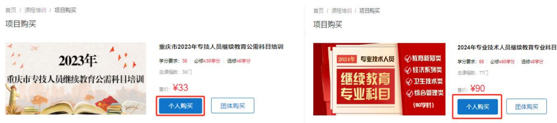
左图为公需科目 右图为专业科目

1.提交订单。在项目购买页面，核实购买项目信息无误后，选择“个人购买”，进入提交订单页面。