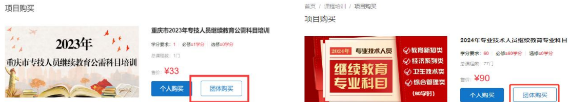
左图为公需科目 右图为专业科目

应学习计划，即可提交订单；购买成功，学员即可登录进行学习。如购买失败，可在页面左下角点击“下载错误文件”，查看原因后进行修改并重新提交订单。